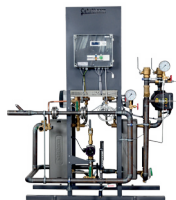
FERNHEIZUNGS- UND KÜHLÜBERGABESTATIONEN